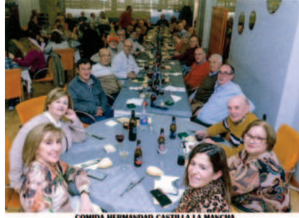
COMIDA HERMANDAD CASTILLA LA MANCHA