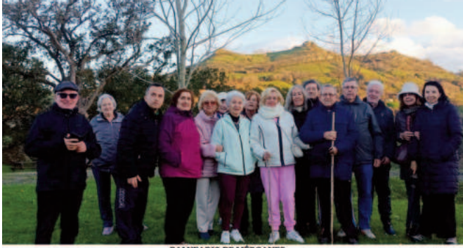
BALNEARIO DE LIÉRGANES