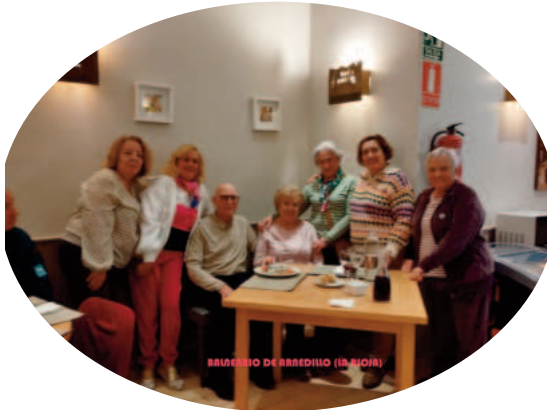
BAILERÍO DE BARRERILLO (LA ALFONSO)