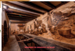
RECREAR EL BARRIO DE BOMI