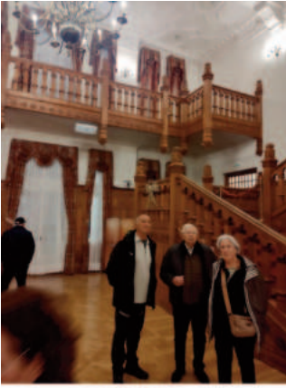
PALACIO DE LA NAZARINA