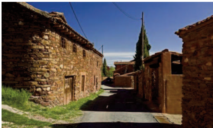
Pueblos Rojos de Segovia

Después del café, nos acercamos a otro pueblo amurallado medieval, Maderuelo, con sus casas de piedra