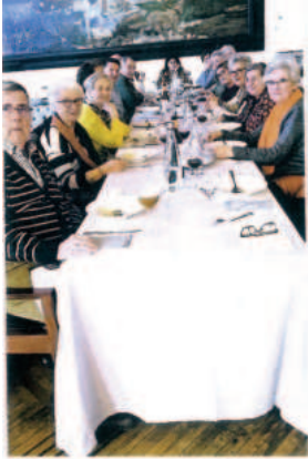
Comida Hermandad Castilla La Mancha