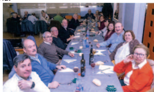
COMIDA HERMANDAD CASTILLA LA MANCHA