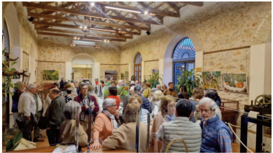
Exposición de pintura de Jesús Adán Villalón en Villarrubia de los Ojos