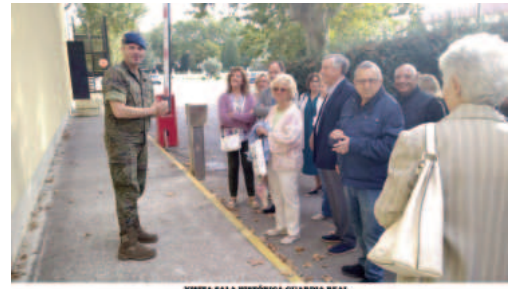
VISTA SALA HISTÓRICA GUARDIA REAL