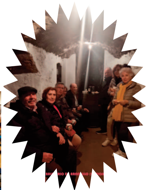
BAILERÍO DE BARRERILLO (LA ALFONSO)