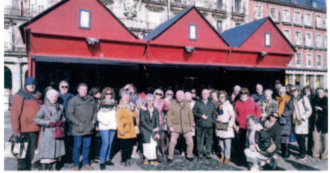
Comida Hermandad Castilla La Mancha