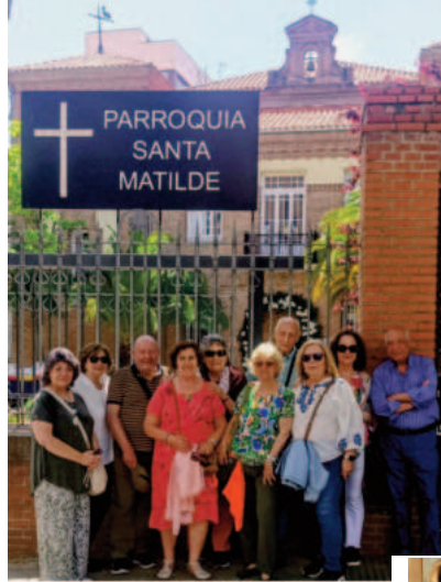
BARRIO DE LA PROSPERIDAD