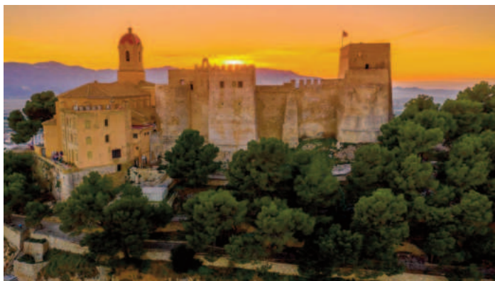
CASTILLO DE CULLERA

Esta ciudad cuenta con varios km de costa, con playas de arena finas y muy cuidadas. Algunas de estas playas son urbanas y otras, más tranquilas, alejadas del centro del pueblo.