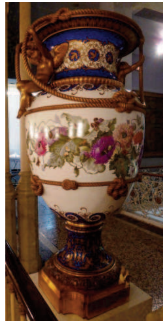
Museo Nacional Artes Decorativas