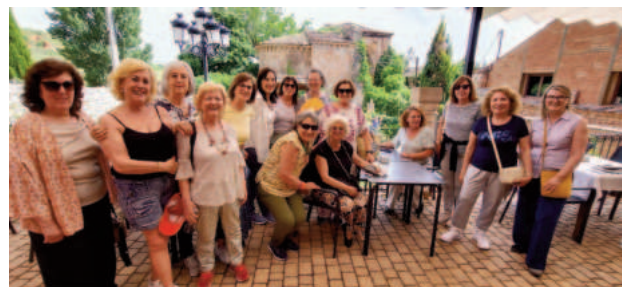
PUEBLOS DE SEGOVIA