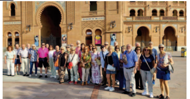
PUEBLOS DE SEGOVIA