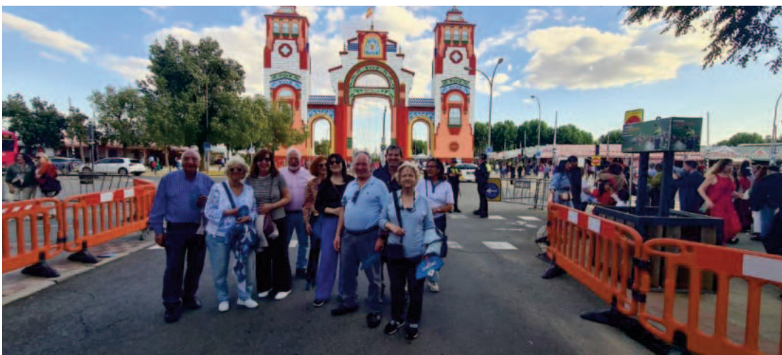
Viaje a Sevilla