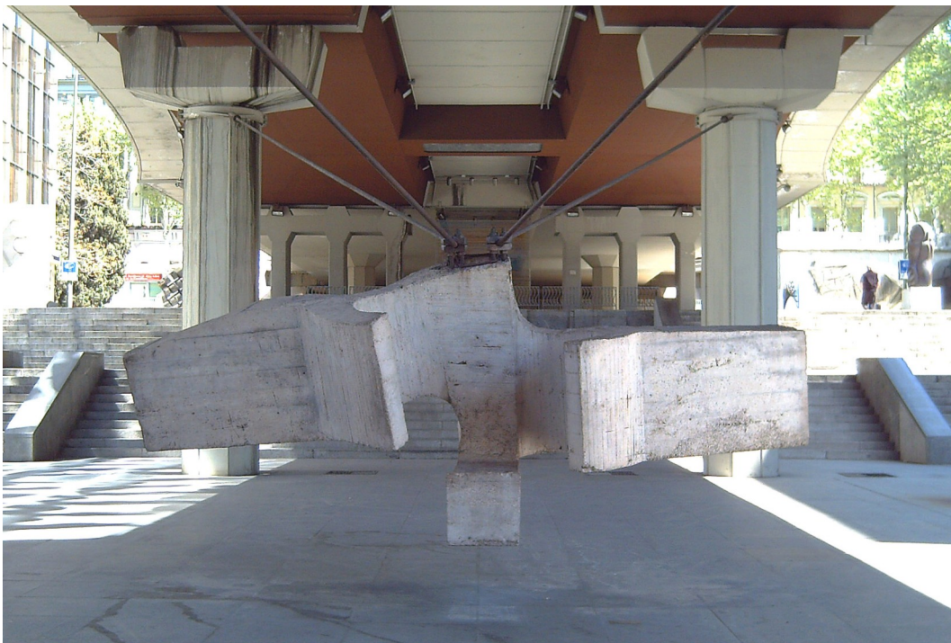
La Sirena Varada (Madrid)

La primera de ellas situada al final de la playa de Ondarreta, a los pies del Monte Igueldo y la segunda que la encontramos colgando de cables