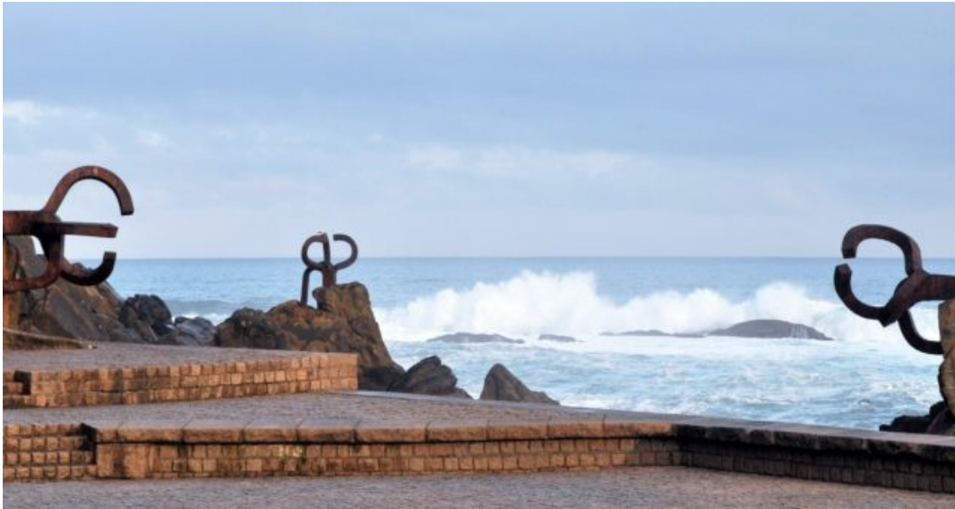
El peine de los vientos (San Sebastián)

Nos encontraremos en el patio del cuartel donde charlaremos un pequeño rato para comentar nuestros conocimientos sobre el autor. Todo ello nos va a permitir una visión del artista que nos hará comprender sus obras más conocidas de gran formato, ya sean en hormigón, en madera o en hierro fundido. Como referencia podemos poner: